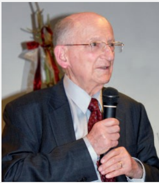
Otto F. Kernberg Ehemaliger Präsident der Internationalen Psychoanalytischen Vereinigung, Im Juni 2012 an der SFU

Die SFU bietet in den ersten zwei Juliwochen den Studierenden die Möglichkeit, die Ferienzeit zur Weiterbildung und Vertiefung zu nutzen. Die zweiwöchige Summer School verbindet Vorträge über unterschiedliche Therapieschulen und Schwerpunkte mit ausführlichen Diskussion und psychotherapeutischen Selbst- und Gruppenreflexionen. Die Research Summer School vertieft eine Woche lang das Forschungswissen der zukünftigen PsychotherapeutenInnen.