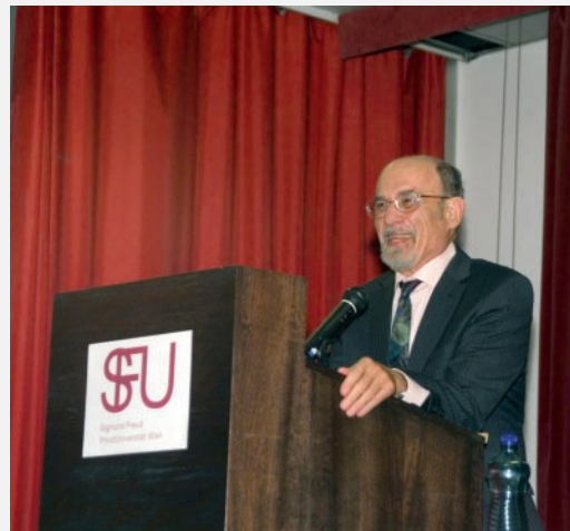
Irvin Yalom , Emeritierter Professor für Psychiatrie, Psychoanalytiker, Autor