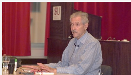
Daniel Stern , Psychoanalytiker, Schwerpunkt Säuglingsforschung