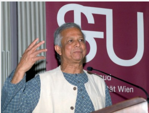
Muhammad Yunus , Nobelpreisträger 2006

Die SFU bietet in den ersten zwei Juliwochen den Studierenden die Möglichkeit, die Ferienzeit zur Weiterbildung und Vertiefung zu nutzen. Die zweiwöchige Summer School verbindet Vorträge über unterschiedliche Therapieschulen und Schwerpunkte mit ausführlichen Diskussion und psychotherapeutischen Selbst- und Gruppenreflexionen. Die Research Summer School vertieft eine Woche lang das Forschungswissen der zukünftigen PsychotherapeutenInnen.